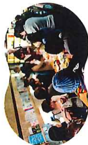
ファンミーティング

当エリアの魅力に触れられるファンミーティングや交流会、PRイベントを定期的に開催。イベント利用にも活用できます。