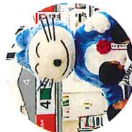
交流会 (11びきのねこ)

当エリアの魅力に触れられるファンミーティングや交流会、PRイベントを定期的に開催。イベント利用にも活用できます。