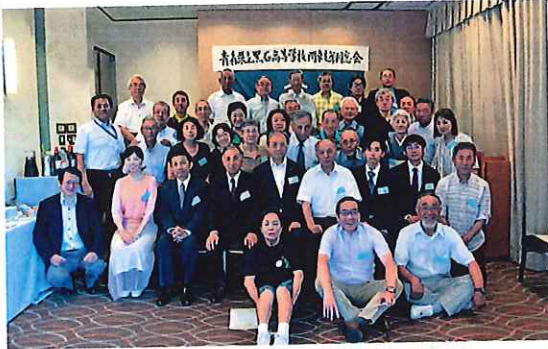
黒石高校同窓会 関東支部総会 八木副会長訪問

加盟各同窓会は、山歩き・料理教室・著名人の講演会や観劇会等、各会独自の内容で一年間のスケジュールを管理しています。そのひとつ「総会」に、高窓連役員が参加させて頂き、高窓連のPRと情報交換をしています。参加する事により顔が分かり、人と人との繋がりが広がります。