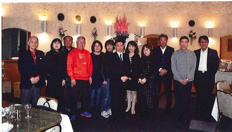
山手賢人会 2019.3.16 例会