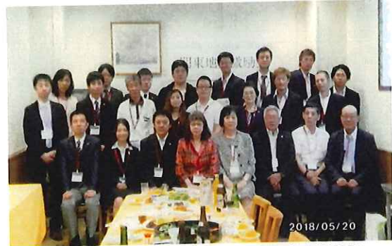
五所川原第一高校同窓会 関東地区激励会 神 顧問 訪問