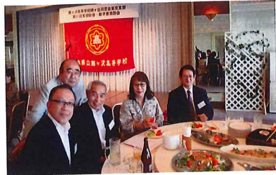
鶴ヶ沢高校同窓会 東京支部総会 三上副会長訪問